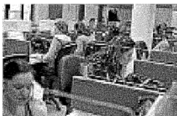
Giovani al lavoro

Quanto al sistema finanziario, il patto suggerisce iniziative di micro-credito e micro-venture per la selezione e il successivo finanziamento di piccole realtà